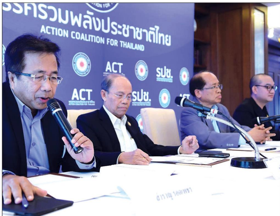
เดินการระฯ : พรรครวมพลังประชาชนไทย (รพช.) ร่วมกันแถลงกิจกรรมของพรรคฯ. โดยจะเริ่มเดินเท้าเข้าชักชวนประชาชนที่มีอุดมการณ์เดียวกัน มาร่วมเป็นสมาชิกพรรค เรียกว่า เดินการระแผ่นดิน ดีเดย์ 25 ตุลาคม ย่านวรจักร เป็นยุทธศาสตร์เหมือน “ดาวกระจาย” ของกปปส.

ทั้งนี้ จากการวิเคราะห์ประเด็นที่จะนำมาซึ่งการยุบพรรคนั้น มีทั้งคดีค้างเก่าที่น่ากังวล โดยแกนนำ และกรรมการบริหารพรรค 9 คน เจอข้อหาฝ่าฝืนคำสั่ง คสช. จัดกิจกรรมทางการเมือง และความผิด